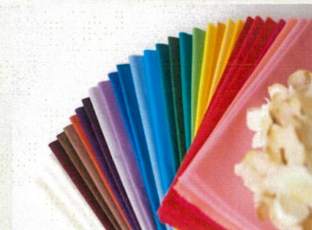
カラーコーディネート